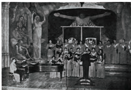
La Sociedad Coral Universitaria

o concebida, a través del estudio de fuentes fehacientes de otra naturaleza” (Roubina, 2010, p. 10) (imagen 7).