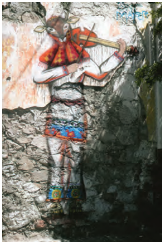
Imagen 1. Anónimo, s. XXI, Alegoría de la Danza del venado , 17 barda callejera, Culiacán, Sinaloa. En la imagen se aprecia la combinación de gestos humanos y representaciones de animales, parte del simbolismo comunitario.

Incluso con las variantes que el simbolismo ofrece con respecto a la realidad geo-temporal en la relación intergeneracional, somos capaces de reconocer significados y funciones de representaciones alteradas con respecto a lo real. Ejemplo de ello son una gran cantidad de las obras que albergan las colecciones de arte de museos y galerías que no se pensaron para la apreciación estética, sino que se imaginaron para una ocasión y con un propósito específico, que el artista tenía en la mente mientras los producía (Gombrich, 1999, p. 32). Adicionalmente, imágenes animadas en las que incluso objetos inanimados o animales hablan, se mueven y actúan como humanos son totalmente reconocibles y aceptadas; en estas situaciones es “perfectamente correcto dibujar cosas de modo distinto a como se presentan, cambiarlas y alterarlas de un modo u otro” (Gombrich, 1999, p. 25). Lo mismo sucede con algunos ejemplos de iconografía musical, como “pintas” en bardas callejeras que representan mitos o tradiciones, que la comunidad identifica y aprehende su significado (imagen 1).