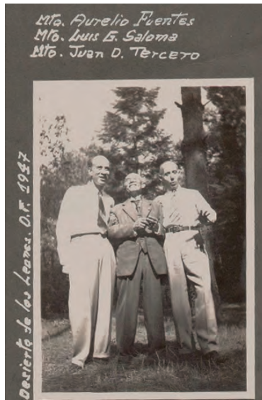
Imagen 4. Tres exdirectores de la Escuela Nacional de Música en convivencia informal (1947), 22 biblioteca Cuicamatini, FaM-UNAM, Fondo Reservado, s. n.

pueden ofrecer detalles y complementar información inexplorada y corroborar datos sugeridos en otras fuentes, que no se han verificado, referentes tanto a aspectos personales como profesionales y vínculos con otros personajes (imagen 4). Entre las líneas de la musicología están el estudio de acervos institucionales y de personas ligadas a las actividades musicales, que, al abrigo de carpetas en fondos reservados de bibliotecas y archivos permanecen en el silencio del olvido.