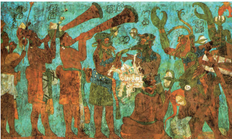
Imagen 2. Músicos y danzantes, pintura mural al fresco en la zona arqueológica maya de Bonampak, Chiapas, México. Presenta a los músicos con instrumentos de aliento y de percusión.

Subyacente al afán de expandir la memoria está la aspiración a perpetuar el ser y el pensar humanos; en la búsqueda por salvaguardar del olvido se han concebido diversos instrumentos para retener las ideas, las creaciones y los instantes de modo que éstos puedan ser evocados con posterioridad; así, en todas las épocas de la historia, acordes a la evolución de los recursos materiales y tecnológicos disponibles en cada una de ellas, se han empleado medios y técnicas de registro y reproducción de la particular realidad, que van desde las pinturas en la piedra de las cavernas o murales en zonas arqueológicas (imagen 2) hasta las imágenes digitales en movimiento. Pese a la gran variedad de posibilidades, todos tienen la finalidad de retener la memoria y trascender como testimonio de la presencia de personajes, situaciones diversas e incluso del momento, por definición fugaz, efímero e inaprensible (Suárez Japón, 2015, pp. 34-35).